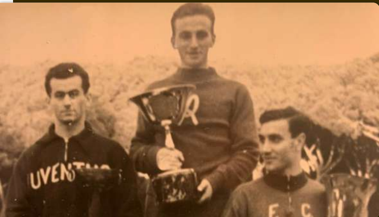
Premiazione del Torneo di Viareggio del 1954